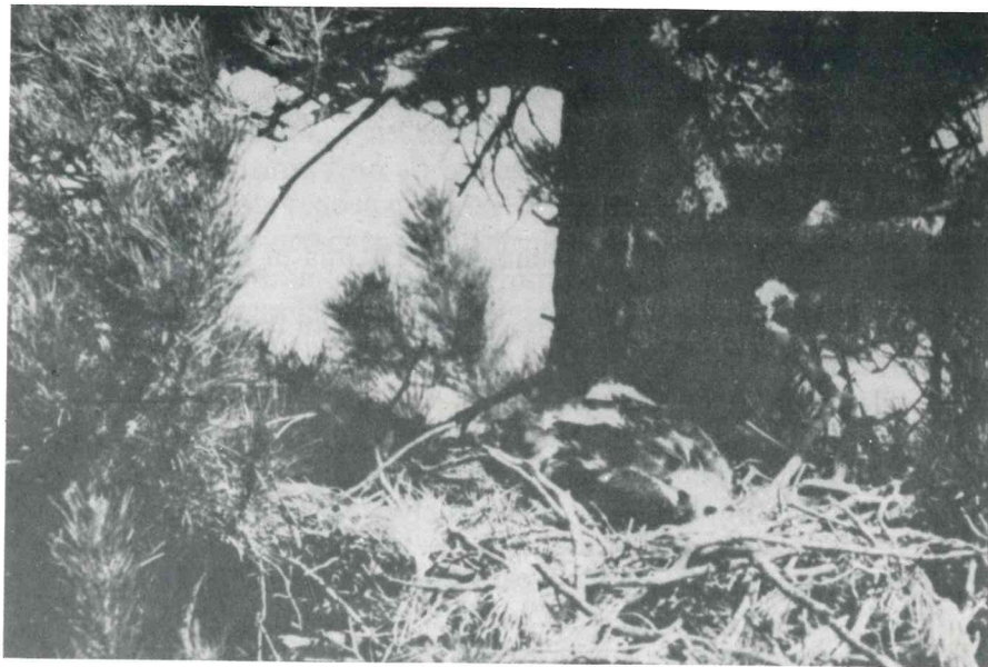
Foto 1: Il pullus sul nido a circa 3 settimane dalla schiusa. (*)